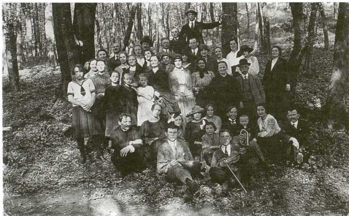
2. Skupina členov spolku na výlete na Železnej studničke. Bratislava 1924