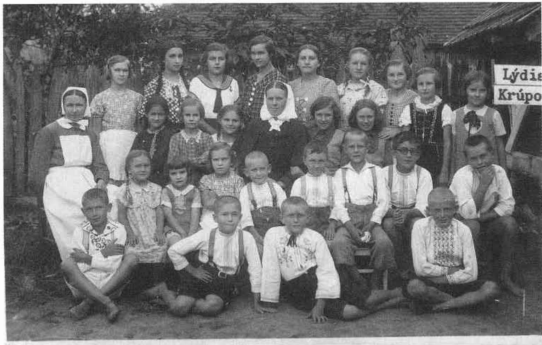
3. Deti členov spolku Modrý kríž na prázdninách medzi deľmi zo Sirotinca na Starej Turej, riadeného miestnym Modrým krížom. R. 1935