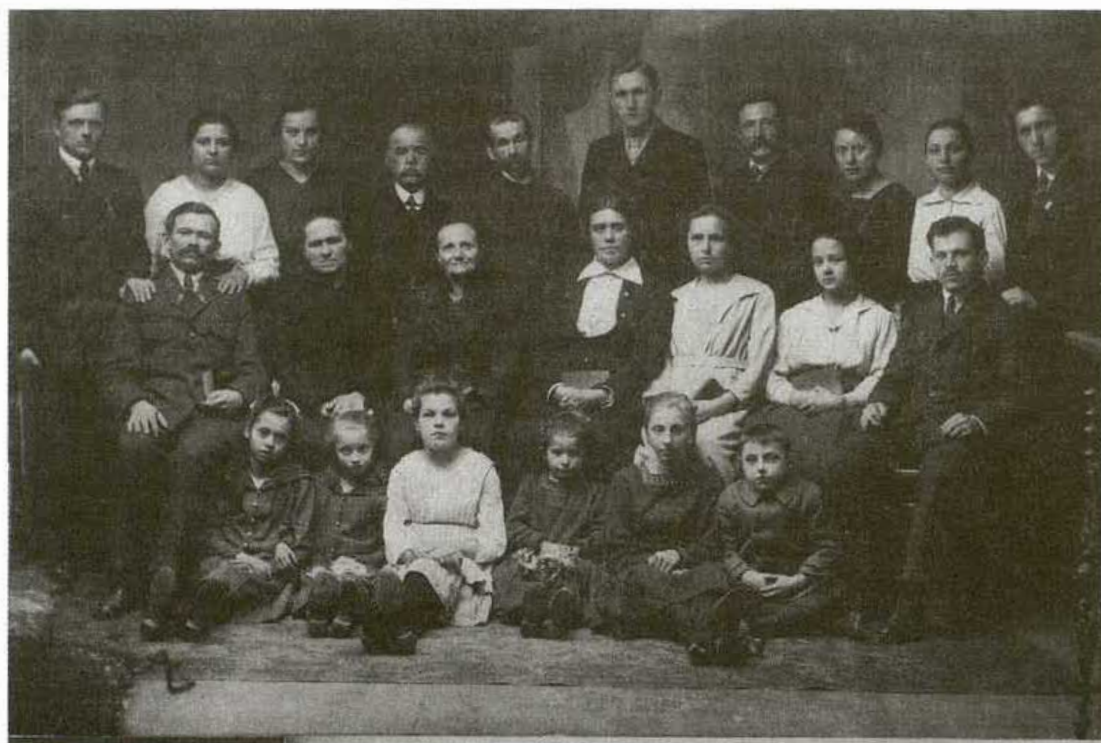
1. Prvé zhromaždenie členov skupiny Modrého kríža v Bratislave v Klingerovej továrni r. 1920. Členovia sú zo Starej Turej, Nyiregyházy a z Čiech