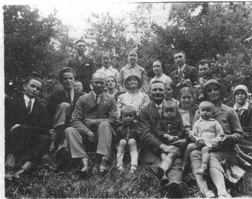
4. Výlet členov spolku na Železnú studničku. Bratislava, r. 1931