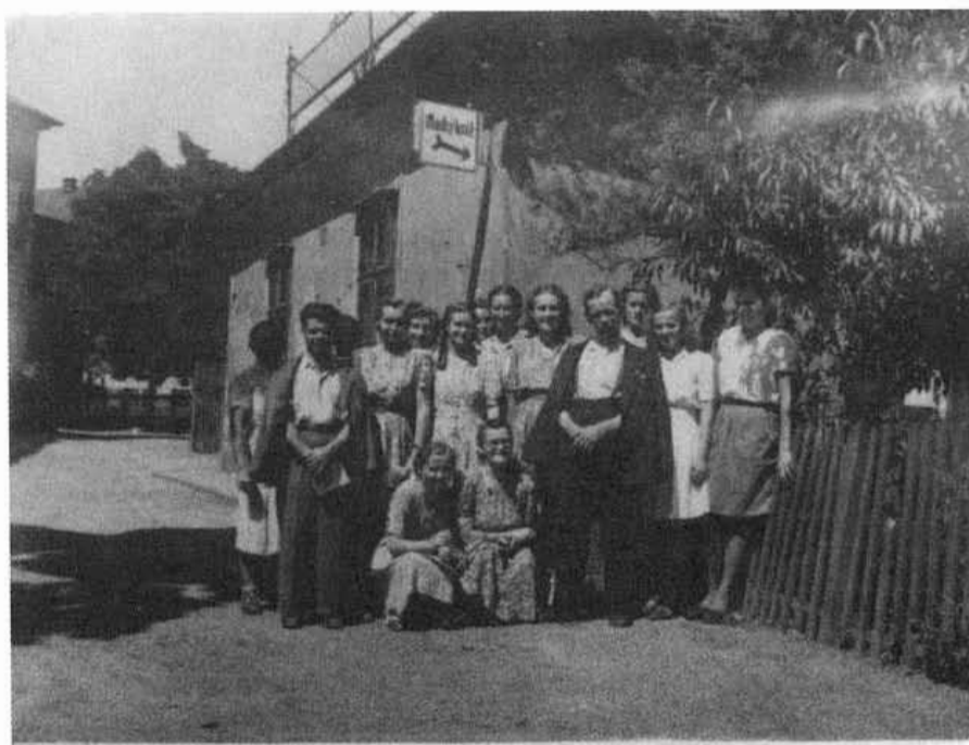
8. Skupina mládeže pred sídlom Modrého kríža v Bratislave. 40. roky 20. storočia