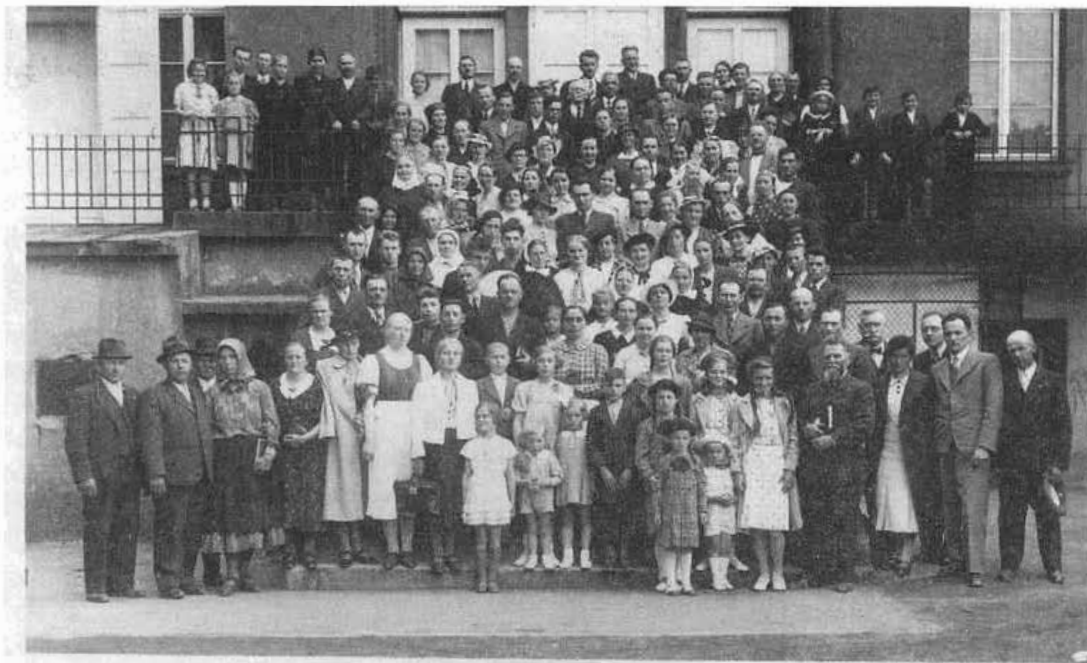
5. Konferencia Modrého kríža v Bratislave v r. 1938. Účastníci sú zo Slovenska aj zo zahraničia