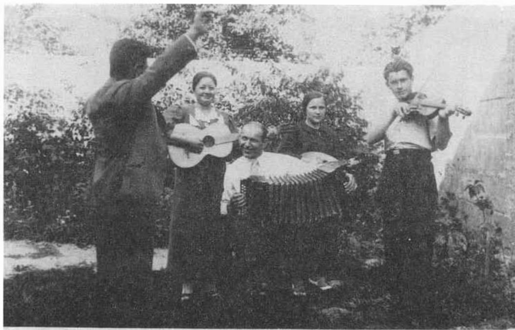
6. Stretnutie členov spolku Modrý Kríž v záhrade domu jeho predsedu. Bratislava, 40. roky 20. storočia