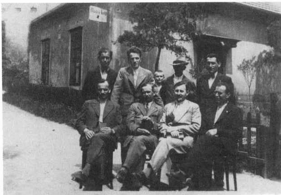
7. Pred sídlom Modrého kríža v Bratislave. 40. roky 20. storočia